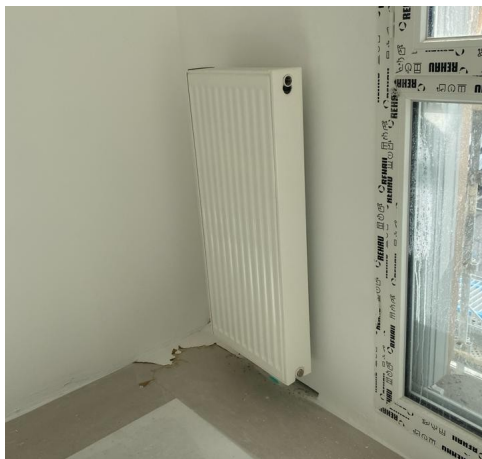
Installation effectuée par un élève de TIT2 l'année dernière. ( Pose d'un radiateur )

On travaille du lundi au vendredi, 35h par semaine.